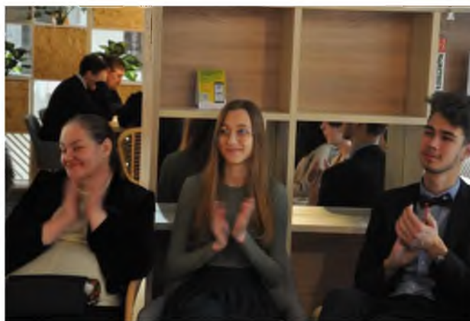
Рис. 10. Участники реализации проекта

Интересным и вполне закономерным результатом проведенных встреч является появление новых социальных контактов, начало дружеских отношений, в основе которых лежит общность интересов.