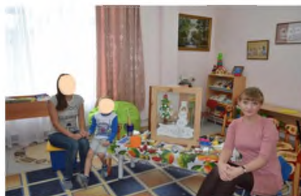
Рис. 3. Совместный рисунок с мамой «Зима пришла»