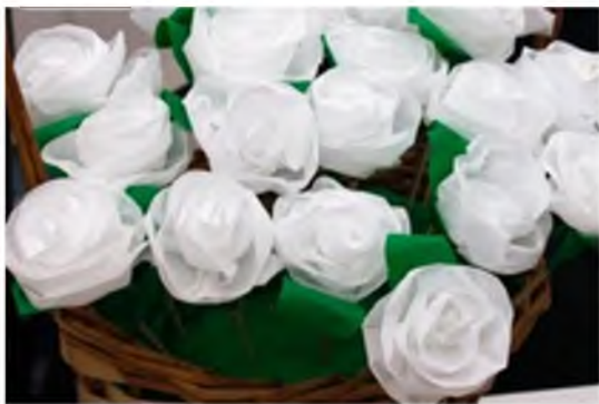
Рис. 6. Белые цветки, изготовленные участниками благотворительного проекта