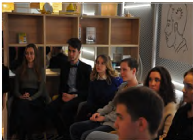
Рис. 9. Участники реализации проекта