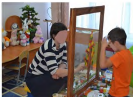
Рис. 4. Совместный рисунок с мамой «Осеннее дерево»