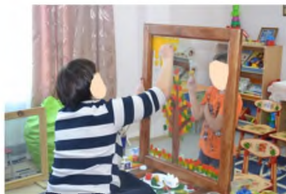
Рис. 5. Совместный рисунок с мамой «Осеннее дерево».

На данном занятии родитель смотрит на мир с позиции ребенка, отрывается от повседневных забот и вместе с ребенком создает продукт совместной творческой деятельности. В памяти через реальные действия закрепляется чувство «я могу понимать», «я могу принимать ребенка», «я могу чувствовать своего ребенка» и в итоге «я могу быть успешным родителем!». Результат совместной творческой деятельности – совместный рисунок – с разрешения родителей запечатлен на фото и видео. Пережитый позитивный опыт, с чувством «я могу быть успешным родителем», создает ресурс в памяти для дальнейшего воспитания ребенка и совершенствования своих родительских компетенций.