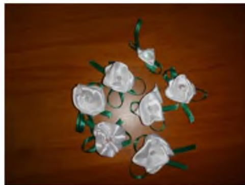
Рис. 7. Белые цветки, изготовленные участниками благотворительного проекта

В общей сложности в подготовленных мероприятиях приняли участие 83 человека из МБОУ гимназия № 161 (обучающиеся, педагоги, родители).