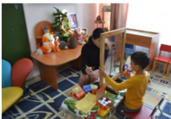
Рис. 2. Совместная творческая деятельность

Идея заключается в создании «прозрачных отношений» между ребенком и мамой. Пример совместной деятельности в рамках данного занятия см. рис. 2–5 1 .