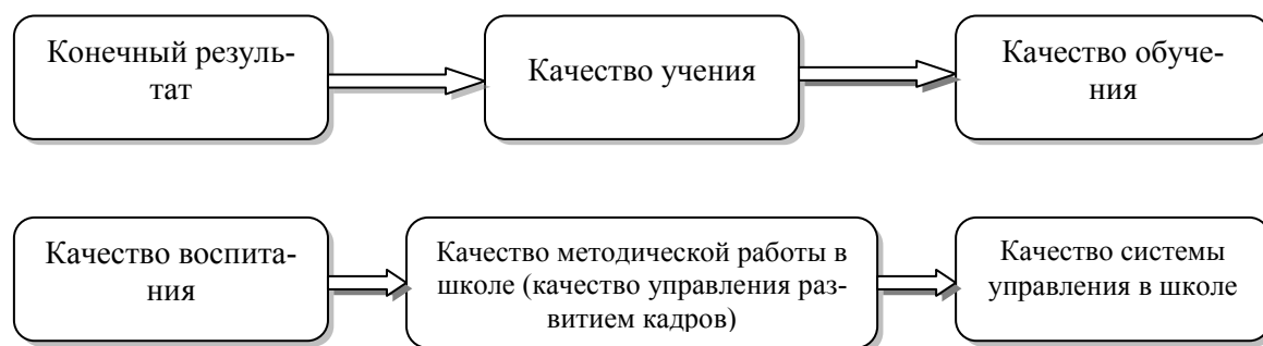
Рис. 2. Факторы, определяющие качество образования школьников

Руководителю школы, учителю следует хорошо разбираться в сущности учения и обучения как процессов, выстроить систему требований, факторов успешного учения и обучения или ответить на вопрос: что влияет на процесс успешного обучения, как помочь ученику научиться учиться? Цепочка качества будет выглядеть следующим образом (рис. 2):