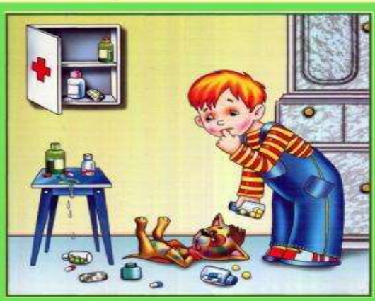
Не трогай таблетки