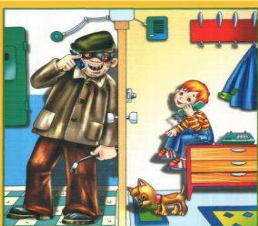
Не разговаривай и не открывай дверь незнакомым людям